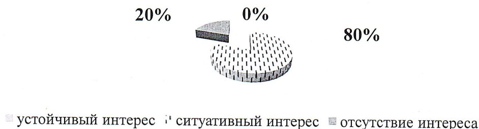
Рис. 1. Особенности интереса к играм – драматизациям у детей экспериментальной группы